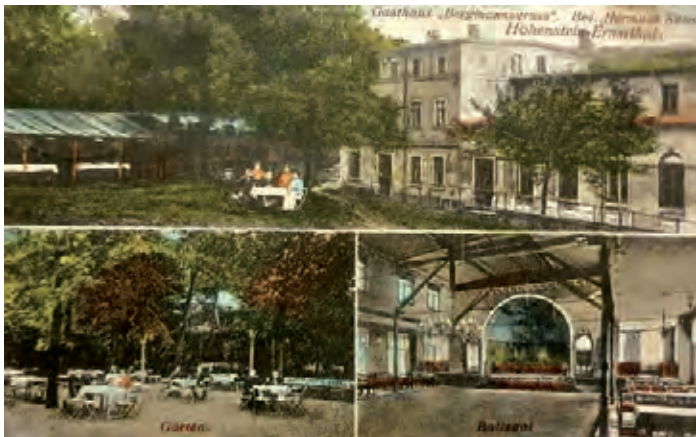
Ansichtskarte um 1900 vom Gasthaus „Bergmannsgruss“ oberhalb des Lampertusschachtes

Über 150 Gast- und Schankwirtschaften soll es laut Recherche von Ortschronisten erstmals in unserer Stadt gegeben haben. Die Landschaft dieses Gewerbes hat sich inzwischen stark gewandelt. Kennen wir die Namen dieser Lokale überhaupt noch, wissen wir, wo sie einst ihren Standort hatten? Reinhard Schüppel hat dazu einen Vortrag erarbeitet, den er uns an diesem Abend präsentieren wird. Für heimatkundlich Interessierte wird das mit Sicherheit ein spannender Abend.