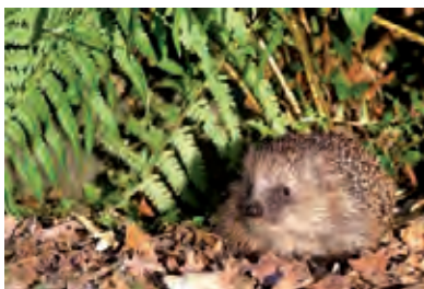
Igel auf Nahrungssuche

Igel sind nachtaktive Tiere. Wenn Gefahr droht, flüchten sie nicht, sondern rollen sich zusammen. So können sie unter die Messer eines nächtlich betriebenen Rasenmähroboters geraten, werden dabei verletzt oder direkt auf schreckliche Weise getötet. Das betrifft auch besonders kleine Jungtiere. Am Tag verstecken sich gesunde Igel oft unter Hecken oder Sträuchern. Dort können sie dann Opfer von Freischneidern, Rasentrimmern oder Motorsensen werden. Die Zahlen des Vereins „Stachelnasen Zwickauer Land e. V.“ belegen, dass dies nicht nur möglich ist, sondern es auch im Landkreis Zwickau viele Fälle von schweren Verletzungen und toten Igel gibt. Igel sind nach dem Bundesnaturschutzgesetz besonders geschützt. Seit