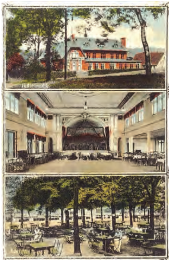
Etablissement „Hüttenmühle“ Hohenstein-Ernstthal