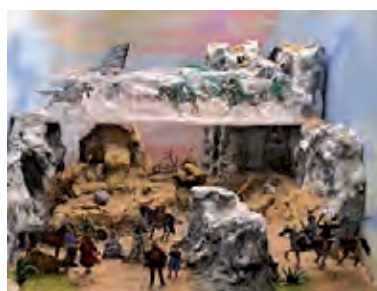
Zinnfigurendiorama „Und Friede auf Erden“

In der Karl-May-Begegnungsstätte finden sich in zwei Räumen des Erdgeschosses 40 wunderschöne Zinnfigurendioramen zu Werken Karl Mays, darunter das abgebildete zu seinem Roman „Und Friede auf Erden“, der aktueller denn je ist. Das Diorama wurde, wie die anderen auch, von Mitgliedern des Vereins Klio – Freunde