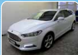
Ford Mondeo Turnier 2.0 TDCi Titanium Business-Paket Weiß, 40.000 km, 110 KW (150 PS) 04/2016 22.595,- €