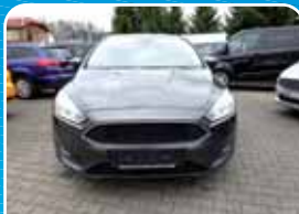
Ford Focus 1.0 EcoBoost Trend Navi, Easy-Driver 3 Grau, 19.993 km, 74 KW (101 PS) 10/2016 15.998,- €