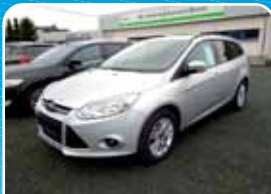
Ford Focus Turnier 1.6 Ti-VCT Trend Winter-Paket Silber, 86.582 km, 92 KW (125 PS) 01/2012 9.450,- €