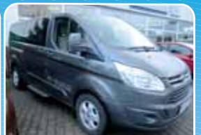
Ford Tourneo Custom 2.0 Tci L2H1 Titanium Sicht-Paket 3 + Autio 40 Grau, 9.874 km, 125 KW (170 PS) 11/2016 36.895,- €