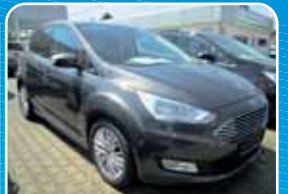
Ford C-Max 2.0 TDCi Titanium Navi, Technologie, Panorama Grau, 23.049 km, 110 KW (150 PS) 08/2015 19.890,- €