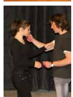
Impressionen vom diesjährigen Passionsspiel, aufgenommen bei der Generalprobe am Abend vor Gründonnerstag.