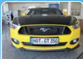
Ford Mustang 5.0 V8 Automatik Fastback GT Premium-Paket Gelb, 7.950 km, 310 KW (421 PS) 03/2016 45.900,- €