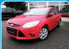
Ford Focus Turnier 1.6 EcoBoost Trend Winter-Paket Rot, 69.987 km, 110 KW (150 PS) 03/2012 10.495,- €