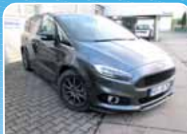
Ford S-Max 2.0 TDCi Aut. 4x4 Titanium Voll, LED, Sport-Paket Grau, 9.985 km, 132 KW (179 PS) 10/2016 36.989,- €