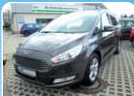
Ford Galaxy 1.5 EcoBoost Business-Edition Navi, Rückfahrkamera Grau, 21.347 km, 118 KW (160 PS) 07/2016 25.750,- €