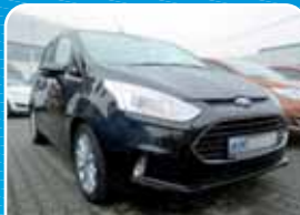
Ford B-Max 1.0 EcoBoost Titanium Sony-CD, Winter-Paket Schwarz, 22.365 km, 92 KW (125 PS) 02/2015 14.950,- €