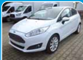
Ford Fiesta 1.5 TDCi Titanium

Weiß, 18.399 km, 70 KW (95 PS) 08/2016 11.950,- €