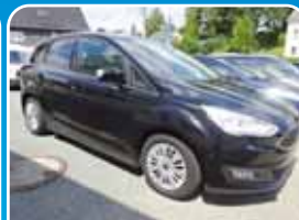
Ford C-Max 1.0 EcoBoost Business Edition Winter-Paket, PDC

Blau, 15.272 km, 92 KW (125 PS) 10/2016 17.495,- €