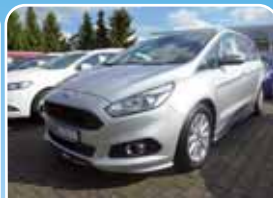
Ford S-Max 2.0 TDCi Titanium Sport-Paket 1, Navi

Weiß 40.000 km, 110 KW (150 PS) 04/2016 21.950,- €