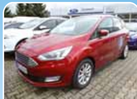
Ford C-Max 1.5 EcoBoost Titanium Xenon, Navi/DAB+, Kamera

Rot, 26.551 km, 92 KW (125 PS) 03/2017 18.950,- €