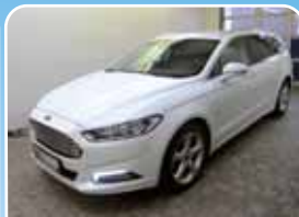
Ford Mondeo Turnier 2.0 TDCi Titanium Business-Paket

Rot, 3.000 km, 110 KW (150 PS) 09/2017 23.495,- €