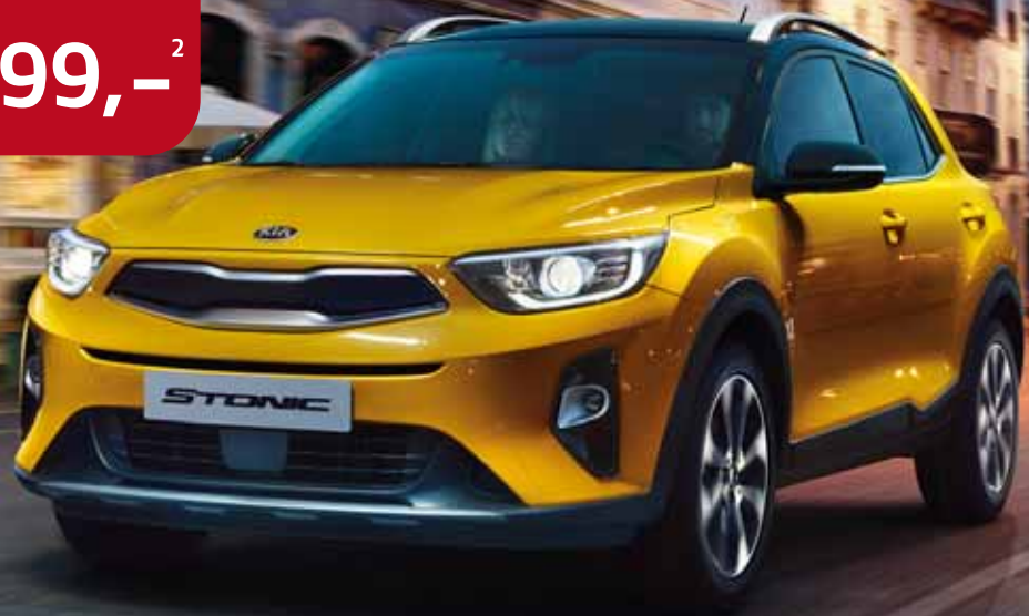
Abbildung zeigt kostenpflichtige Sonderausstattung.