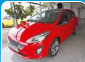
Ford Fiesta 1.1 Titanium Cool & Sound-Paket 4, DAB+

Weiß, 18.399 km, 70 KW (95 PS) 08/2016 11.950,- €