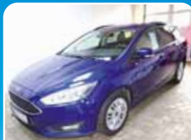
Ford Focus Turn. 1.0 EcoBoost Business Navi-Winter-Paket

Rot, 1.900 km, 63 KW (86 PS) 11/2017 16.935,- €