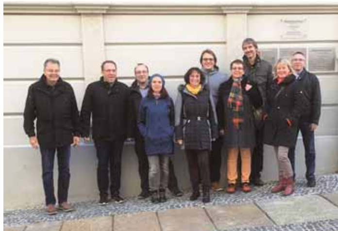
Für seine Rüstzeit hatte sich unser Kirchenvorstand in Görlitz einquartiert.

Die anstehende Gemeindestrukturereform, Bauaufgaben und Haushaltsfragen sowie nicht zuletzt das diesjährige Reformationsjubiläum waren Themen, denen sich unser Kirchenvorstand (KV) in den vergangenen Monaten neben dem „Tagesgeschäft“ zu widmen hatte. Die diesjährige Rüstzeit des KVs, die ihn diesmal in die CVJM-Herberge nach Görlitz führte, konzentrierte sich thematisch auf Glaubens- oder theologische Fragen: Mit einer eingehenden Beschäftigung mit Jesu Vater-unser-Gebet. Den Abschluss der Rüstzeit bildete ein Gottesdienst mit einer polnischen Gemeinde.