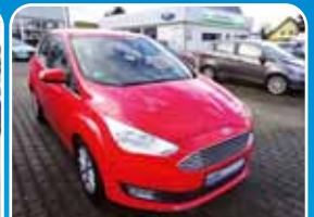
Ford C-Max 1.0 EcoBoost Titanium Business-Paket

Schwarz, 22.026 km, 92 KW (125 PS) 11/2016 18.995,- €