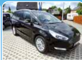
Ford Galaxy 1.5 EcoBoost Titanium Navi, LED, KEYFREE

Silber, 21.595 km, 132 KW (179 PS) 06/2016 26.495,- €