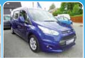
Ford Tourneo Connect 1.5TDCi Titanium, L2, Navi/DAB+ Technologie-Paket

Schwarz, 20.410 km, 118 KW (160 PS) 11/2016 27.990,- €